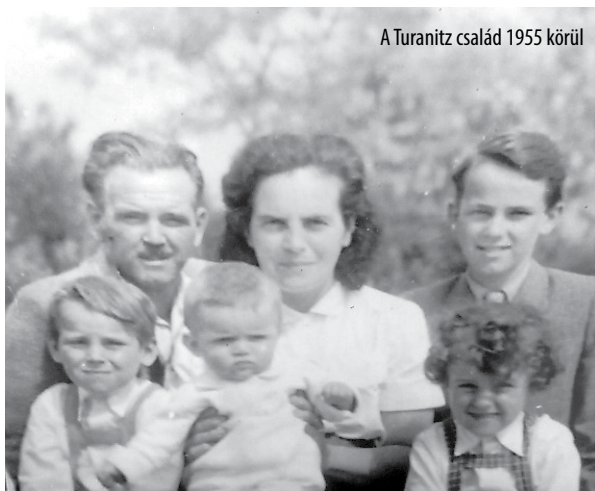
A Turanitz család 1955 körül

a begyűjtés. Ezeket az embereket mind bevitték Fehérvárra, ahol akkor már apánk is rab volt. Hetekig benn tartották őket, azt se tudtuk, hogy hol vannak, mit csinálnak, mindenki attól félt, hogy internálják őket.