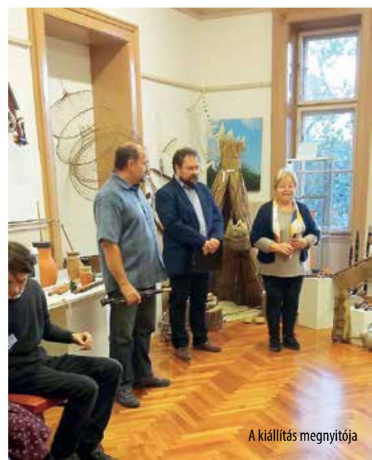
A kiállítás megnyitója

A népi hangszereket nem elég csupán tárgyi mivoltukban vagy zenei teljesítőképességük szempontjából vizsgálnunk, hanem meg kell ismernünk azok múltját, társadalmi szerepét, megfelelő esetekben készítési módját, vagyis meg