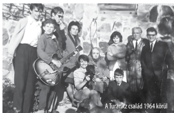
A Turanitz család 1964 körül

Facebook: A Helytörténeti Egyesület oldalát kedvelő ismerőseid